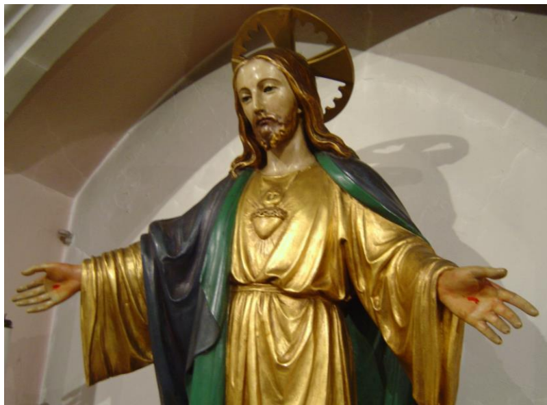
Sacré Cœur, Eglise Anglicane St Paul, Brighton

“Dieu donnera aux 5'000 personnes, parce que chacun de ceux qui étaient présents en parlera à 5 autres”. Nous rendons grâce à Dieu.