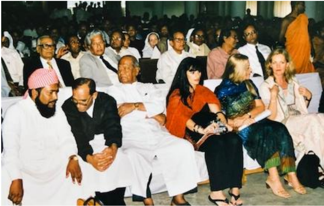
Cérémonie des Awards

remise des Gold Awards 2003 pour la Paix, suivie d'un spectacle de chansons et de ballets.