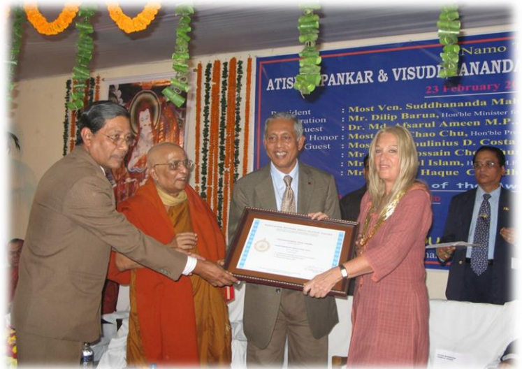
Remise des Gold Awards

Quatre Gold Awards pour la Paix ont été attribués à 4 personnes :