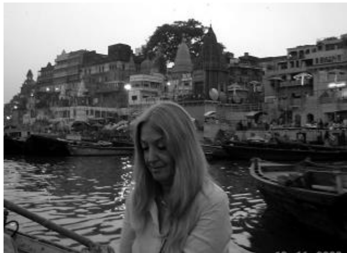
Croisière sur le Gange

Que la gloire de notre Dieu d'Amour brille dans tous les cœurs ! Gloire à Jésus !