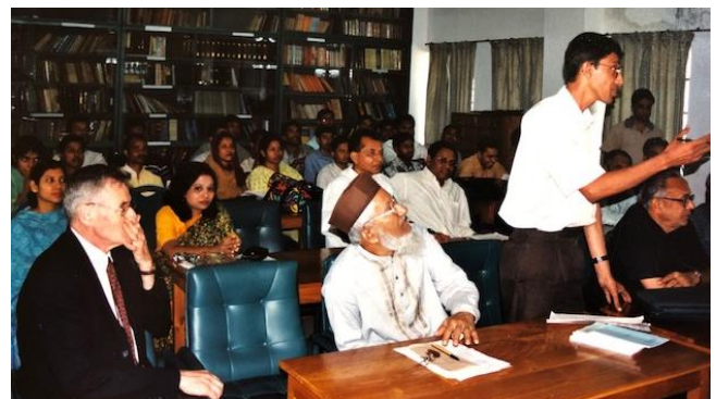
Université de Dacca